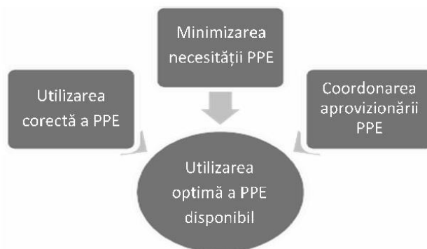
Fig. 1. Strategii de optimizare a disponibilității echipamentului individual de protecție (PPE)

(1) Având în vedere deficitul global de echipament individual de protecție, următoarele strategii pot facilita utilizarea optimă a PPE (fig. 1).